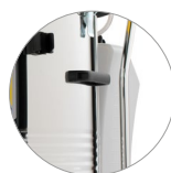
Serbatoio soluzione detergente