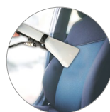
Ideale per ogni superficie