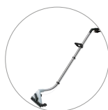
Bocchetta pavimenti estrazione (optional)